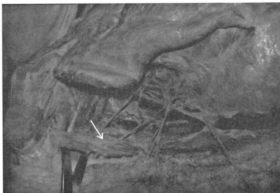
▼ شکل ۲. ناحیه آگزیلاری راست. قوس عضلانی آگزیلاری (←) در تصویر نشان داده شده است.