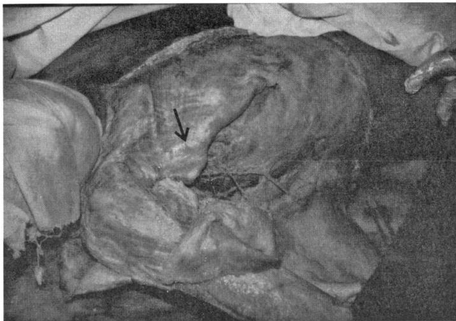
▲ شکل ۱. عضله پکتورالیس بزرگ در جسد